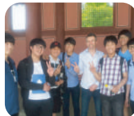
유네스코 레인보우 프로젝트