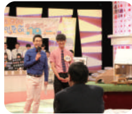
KBS 스카우트 우승