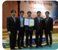
기능경기대회 정비부문 금메달