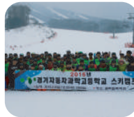
2박 3일 스키캠프