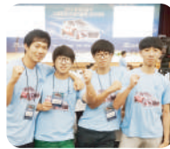
현대자동차 공모전 본선