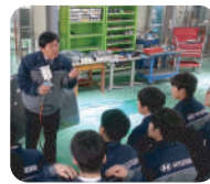
대한민국 자동차 명장 학교 운영